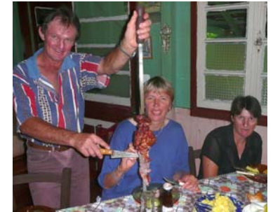
Bild: Gastfreundschaft in Brasilien – Die Menschen haben wenig und teilen alles!