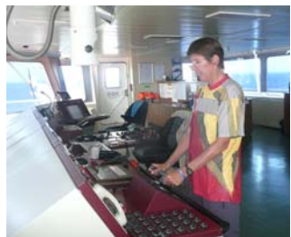
Bild: Schiffs-Fahrunterricht beim Kapitän...