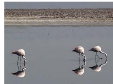
Bild: Flamingos am Wasser, Atacamawüste

Weitere Highlights sind dann: CHILE : eine (nicht ungefährliche) Trekkingtour im Nationalpark Torres del Paine (mit Windstärken von 120 km/h am Pass, Gletscherflussüberquerungen und Mäusen im Zelt...). Von Ushuai aus, der südlichsten Stadt der Welt, eine abenteuerliche Kap Horn-Umrandung mit dem Segelboot. In der Einsamkeit der Atacamawüste , der trockensten Wüste der Erde.